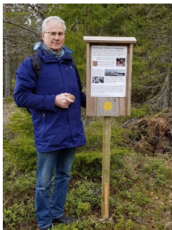
Geologi-info i Fällsvik

Ett räcke av järnstänger och tross sattes upp våren 2020 från Bredviken österut. Tillsammans med trossen på den västra branten året innan kan etapp 3 nu beskrivas som krävande istället för mycket krävande.