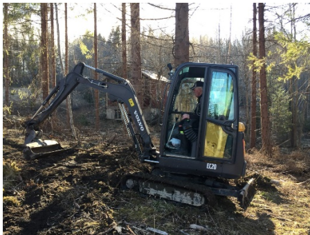
Grävning för nya leder i Salsåker

Exempel på andra föreningars arbeten med anslutande leder: