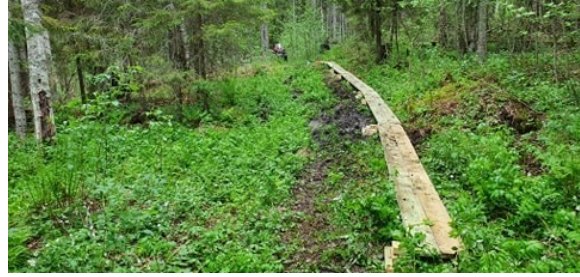
Nya spångar till västra sidan av Ringkallen

Praktiska insatser längs leden 2019–20 inför den nya kartan: