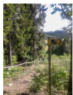
Karta i Bönhamn, uppstädning och märkning av leden vid Bredviken, räcke mellan Omne och Klocke.