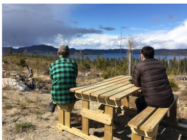
Bord vid Sjubrö

I Grista, Gammnolvika, Sjubrö, Fällsvik, Sörle och ovanför Kåsta placerades rastbord ut för att höja standarden på tidigare ganska anonyma delar av leden.