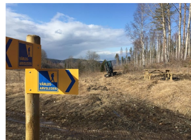
Bord i Grista