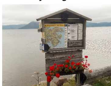
Kartan med Själandsklinten som fond