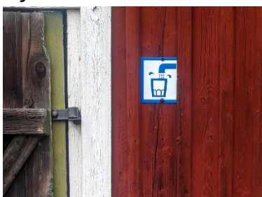
Vattenkran och uppdaterad infotavla i Mjällomslandet