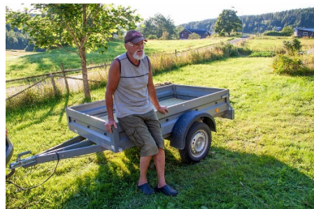
och från Älgsjö