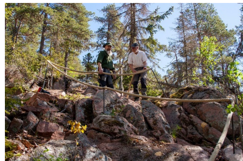
Trossräcket öster om Bredviken