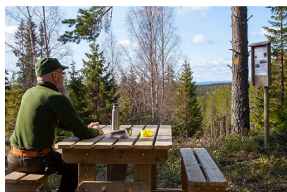
Bord i Fällsvik