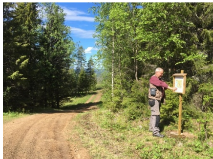
och på Ringkallen