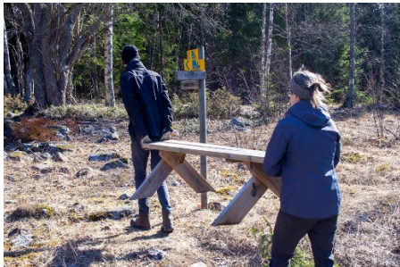
Medhjälpare i Näsänget

Vi har ett fantastiskt nätverk på cirka 70 personer och andra föreningar som ideellt hjälper till och tar hand om olika avsnitt av leden. Tusen tack till er alla! Uppgifterna varierar beroende på avsnittets behov och på vad var och en har tagit på sig att göra. I flera fall är det fullt ansvar som gäller.