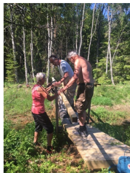
Nya bron längs Björnåsleden